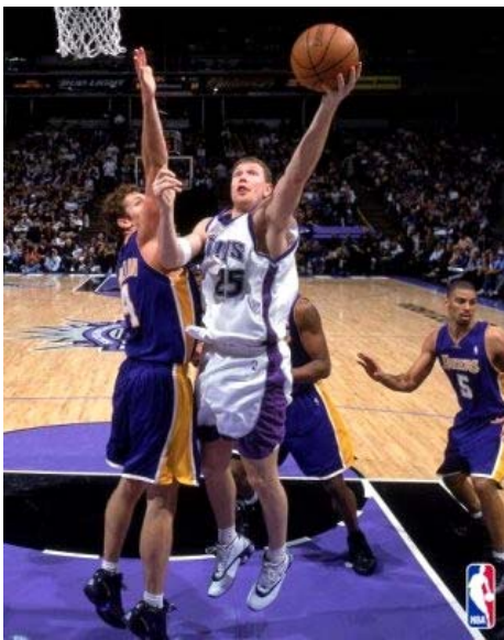
Darius Songaila

Nuo to laiko, kai atgavo savo nepriklausomybę 1990 metais, lietuviai jau keturis sykius žaidė krepšinį Olimpiadoje. Tris kartus iškovojo bronzos medalius, o 2004 m. pirmą kartą pralenkė JAV , nors vėliau jai pralošė žaidime dėl bronzos medalio.