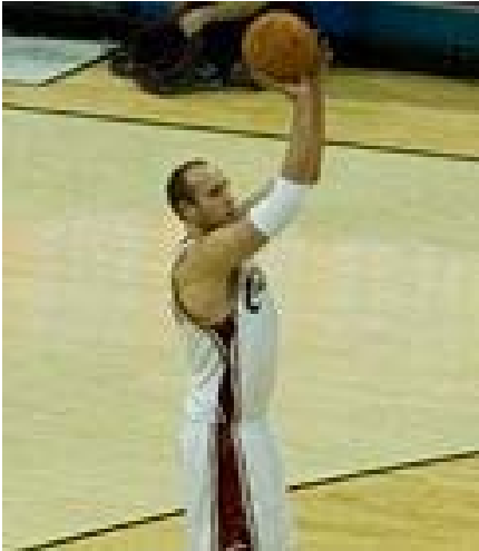
Žydrūnas Ilgauskas

Lietuviai laimėjo trečią vietą 2007 Europos krepšinio pirmenybėse, todėl bus viena iš tik dvylikos komandų dalyvaujančių Olimpiniuose žaidimuose Kinijoje.