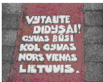
Vytauto Didžiojo paminklo detalė

Po Antrojo pasaulinio karo kaip ir visoje Lietuvoje daug Perlojos šeimų buvo išvežta į Sibirą. Daug perlojiškių stojo į partizanus ir žuvo miškuose, kovodami su okupantais.