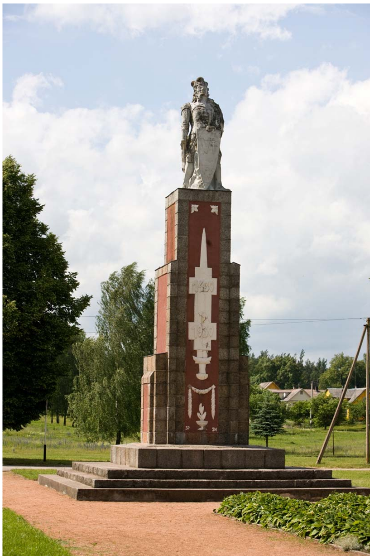
Vytauto Didžiojo paminklas Perlojoje

Tarpukariu perlojiškiai per porą metų pasistatė bažnyčią 1928-1930 m., o 1931 m. - paminklą Vytautui Didžiajam. Šį paminklą perlojiškiai išsaugojo per visą sovietų okupaciją.