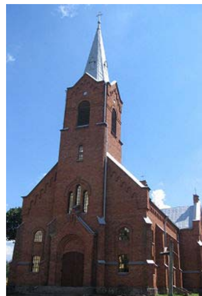
Perlojos bažnyčia

Kai lenkai atsisakė pasitraukti iš užgrobtų Lietuvos žemių ir grąžinti Vilnių Lietuvai, demarkacinė linija tarp Lenkijos ir Lietuvos vienu metu ėjo Merkio upe. Ta demarkacinė linija padalijo Perloją į dvi dalis, vieną dalį paskirdama Lenkijai. Perlojiškiai nedavė ramybės net ir lenkų reguliariosios kariuomenės būriams