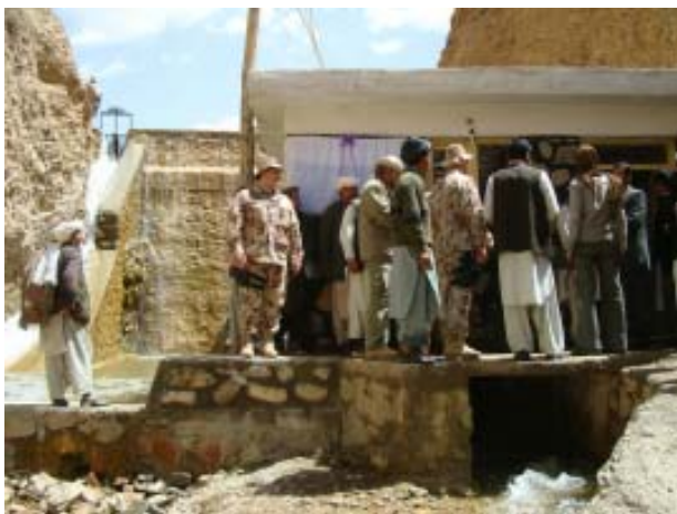
Trečioji Lietuvos lėšomis pastatyta mažoji hidroelektrinė