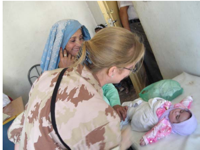
PAG medikė padeda vietos gyventojai

Nuo 2005 metų birželio Lietuva vadovauja NATO Tarpautinių saugumo paramos pajėgų Provincijos atkūrimo grupei (PAG). PAG pagrindinė užduotis yra padėti Afganistano valdžiai plėsti įtaką provincijoje , užtikrinti saugumą ir sudaryti tinkamas sąlygas provincijai atkurti. Goro provincijoje PAG turi apie 130 karių iš Lietuvos ir apie 50 iš Danijos, Kroatijos ir Ukrainos.