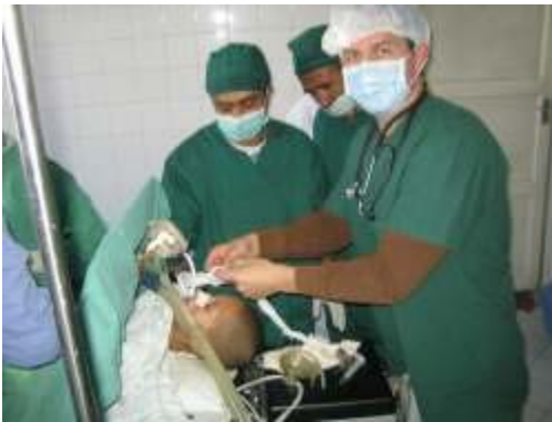
PAG-6 lietuviai medikai operuoja sunkiai sergantį vaiką

Jarmalavičius – antrasis Lietuvos karys, žuvęs tarptautinėje taikos misijoje. Prieš dvylika metų Bosnijoje visureigiui užvažiavus ant minos buvo mirtinai sužalotas karininkas Normantas Valteris.