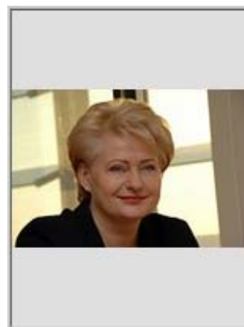
Dalia Grybauskaitė

nespės. Juk visos 27 ES šalys turės su tuo sutikti. O juk liko tik metai su puse! Ir dar nėra pateiktas formalus prašymas.