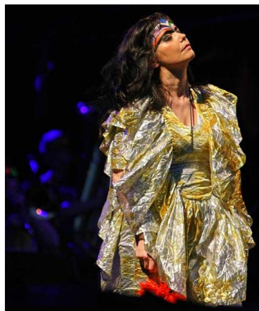
Björk Vilniuje

kurio klipas daug kam primena Björk klipą „I am a Hunter“.