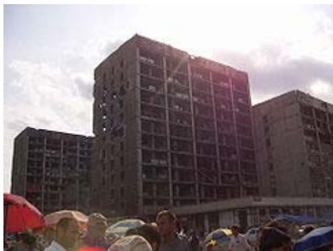
Daugiabučiai pastatami Grozne laukia atstatymo

Čečėnai priešinasi – jų prezidentas, Maschadovas, pabėgo į kalnus ir vėl tapo partizanų vadu - bet nuo to laiko Rusijos galia Čečėnijoje vis stiprėja. 2005 m. buvo nužudytas Maschadovas.