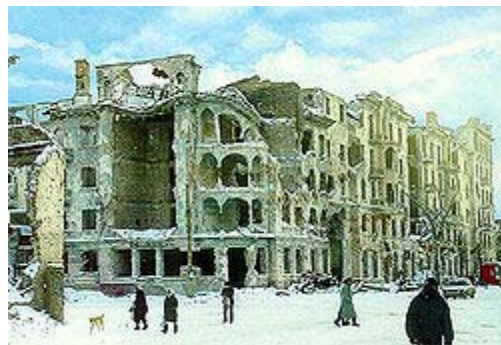
Čečėnijos sostinės, Grozno, vaizdas po 1996 m. karo

Tačiau 1995 m. Rusijos kariuomenė su 45,000 kareiviais užpuolė Čečėniją ir prezidentas Dudajevas žuvo raketos sprogime. Po žiauraus karo, kuriame žuvo apie 70,000 žmonių, čečėnams pasisekė išsikovoti nepriklausomybę. 1997 m. jie išsirinko antrą prezidentą – Aslaną Maschadovą.