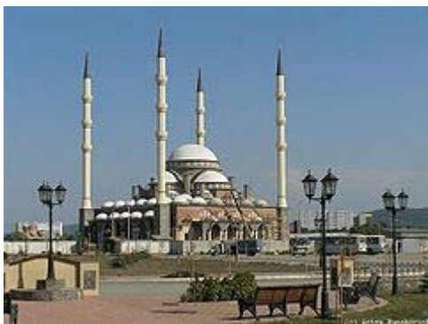
Neseniai pastatyta musulmonų šventykla Grozne

Čečėnai sukilėliai nenustojo kovoję prieš rusus, ir ėmė naudoti teroristinius veiksmus. Gal garsiausias iš šių įvykių 2004 m., kai čečėnų partizanai užėmė mokyklą ir laikė 1,100 mokinių, mokytojų ir tėvų įkaitais . Žuvo 335 įkaitų, jų tarpe 156 vaikų. Šamilis Basajevas, čečėnų partizanų vadas, buvo atsakingas už šį įvykį. Rusai jį nužudė 2006 m.