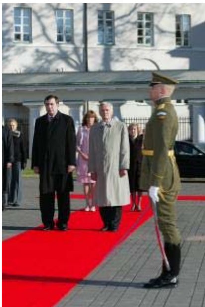
Gruzijos prezidentas Saakašvili su prezidentu Adamkum Lietuvoj

Tuo tarpu Rusija užėmė Pietų Osetiją ir Abchaziją. Nepaisant to , kad pažadėjo iš ten pasitraukti , ji to dar nepadarė. Verčiau, paskelbė tuos regionus nepriklausomomis valstybėmis ir laiko ten savo kariuomenę.