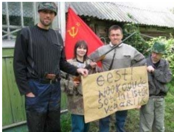
Juodas humoras

Estai tiki, kad tai realu. Rugsėjo mėnesį, po Rusijos karo su Gruzija, dvi šeimos Estijos šiaurės rytų pakrašty pasiskelbė sudarančios nepriklausomą respubliką ir prašė, kad Rusija pripažintų jų nepriklausomybę. Gal jie tik juokavo, bet jų veiksmas pailiustravo estų rūpestį - Rusija gali įžengti į Estiją, užimti Estijos žemes, ir paskelbti jose naują nepriklausomą respubliką taip, kaip padarė Abchazijoje.