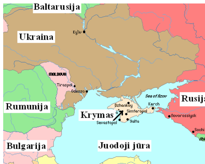
Krymas, dalis Ukrainos, kur dabar yra Rusijos laivyno bazė

Dabar pažiūrėkim į Ukrainą. Ukrainai priklauso pusiasalis Krymas. Jis priklausydavo Aukso Ordai, po to Turkijai, po to Rusijai, o dabar – Ukrainai. Daugiau negu pusė Krymo gyventojų yra rusų kilmės. Staiga spalio mėnesį smarkiai pradėjo augti Rusijos piliečių skaičius Kryme.