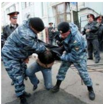
Estijos kareiviai tramdo riaušininką Taline

Dėl to veiksmo Rusijos vyriausybė viešai išpeikė Estiją. Kilo masinės rusų riaušės Estijoje. Buvo areštuoti daugiau negu 1,200 žmonių. Net žuvo vienas Rusijos pilietis, gyvenantis Estijoje. Estija kaltino Rusiją, kad ji išprovokavo riaušes. Tuoj po to ėmė augti Rusijos piliečių skaičius Estijoje.