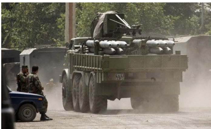
Netoli Estijos atsirado Rusijos raketų paleidimo sistema „Uragan“

Kuo reikšmingas rugsėjis? Estija (kartu su Latvija ir Lietuva) pasmerkė Rusijos veiksmus Gruzijoje (žrk. „Laikai vaikams“ rugsėjo ir spalio numerius). Ragino NATO ir ES nares taip pat pasmerkti Rusijos agresiją. Ar Rusija planuoja įžengti į Rytų Virumą ir paskelbti ten atskirą nepriklausomą rusų respubliką? Rusijos atstovybė kategoriškai neigia, kad masiškai išduoda rusiškus pasus Rytų Virumos apskrityje. Vis dėlto estai nerimsta.