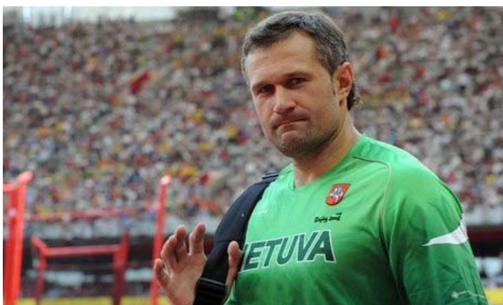
Virgilijus Alekna

- Virgilijus Alekna, 36-erių metų disko metikas, turbūt labiausiai mylimas sportininkas Lietuvoje. Jis jau du sykius laimėjo aukso medalį olimpinėse rungtynėse ir dukart išsikovojo pasaulio čempiono titulą.