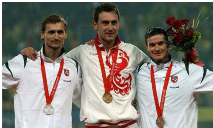
Edvinas Krungolcas (kairėj) ir Andrėjus Zadneprovskis (dešinėj)

- Penkiakovė – penkių visiškai skirtingų sporto šakų kombinacija. Penkiakovininkai varžosi šaudymo, fechtavimo , plaukimo , jojimo ir kroso disciplinose. 2008 Olimpiadoje penkiakovę laimėjo du lietuviai: 35-erių metų Edvinas Krungolcas – sidabrą ir 34-erių metų Andrėjus Zadneprovskis – bronzą. Jie ypatingai švytėjo jojime ir bėgime.