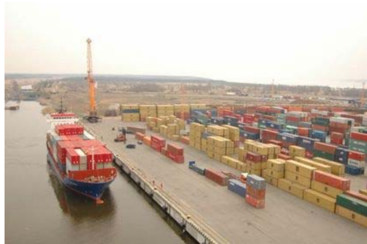
Klaipėdos uostas

Plečiant Lietuvos transportą atsiranda naujų reikalavimų, naujų darbų. Lietuviai iš patirties žino to laukti. Tačiau neseniai atsirado ypatinga kliūtis - per karą Gruzijoje rusai subombardavo Poti uostą, sulėtindama Lietuvos ir jos partnerių darbą.