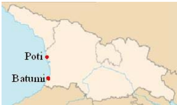
Gruzijos uosatai Poti ir Batumi

„Vikingas“ kursuoja tarp Ukrainos ir Lietuvos, sujungdamas Juodąją jūrą su Baltijos jūra. Juodojoje jūroje veikia vieni didžiausių pasaulyje jūrų geležinkelio keltai . Jie turi geležinkelio bėgius, kad būtų sklandus perėjimas iš žemės į vandens transportą. Jie neša „Vikingą“ iš Ukrainos į Gruzijos uostus Poti ir Batumi. Iš Poti „Vikingas“ kursuoja į Kazachstano pusę, o iš Batumi - į Turkijos pusę.