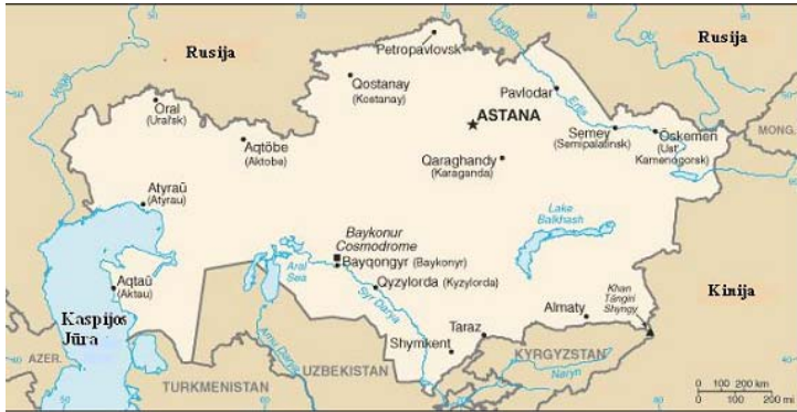
Kazachstanas (iš www.cia.gov )

transportuoti prekes į šias vietas, būtina turėti intermodalinio transporto įrangą .