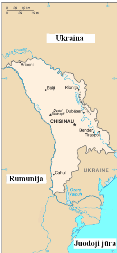
Moldova ir jos kaimynės – Ukraina ir Rumunija

Moldova ir Rumunija labai giminingos, panašiai, kaip lietuviai ir žemaičiai. Rumunija jau priklauso Europos sąjungai, tai atrodo natūralu, kad ir Moldova priklausytų Europos sąjungai.