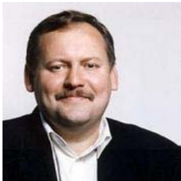
Rusijos seimo narys Konstantinas Zatulinas

Osetija (žr. „Laikai vaikams“ spalio, lapkričio ir sausio numerius). Šią savaite tai patvirtino Rusijos Dūmos atstovas Konstantinas Zatulinas.