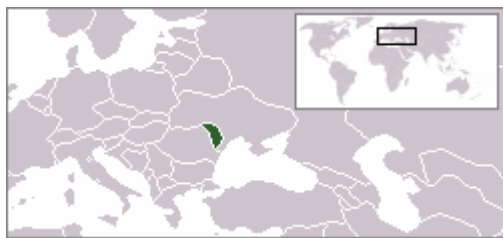
Moldova, pažymėta žaliai (iš wikipedia)

Pažiūrėkime, kas vyksta vienoje iš šių valstybių – Moldovoje.