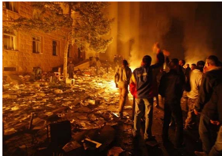
Riaušės Moldovoje po parlamentinių rinkimų

Vieni mano, kad rinkimai buvo suklastoti . Kai Moldovos piliečiai išgirdo rinkimų rezultatus, jie labai supyko. Daugiau negu 15,000 žmonių susirinko prie Parlamento rūmų protestuoti rinkimus. Įvyko riaušės . Protestuotojai užėmė parlamento rūmus, reikalaujami, kad rinkimų rezultatai būtų patikrinti.