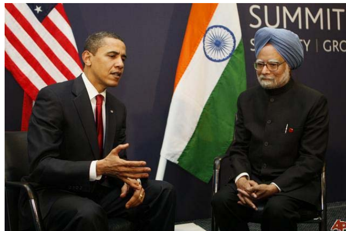
JAV prezidentas Obama ir Indijos Ministras pirmininkas Manmohanas Singhas

Iš Indijos spaudos akivaizdu , jog indams imponuoja daugiau negu $1,000,000,000,000 kuriuos G20 paskyrė ekonominei krizei įveikti . Ir pakartotinai minima, kad Obama jų Ministrą pirmininką Manmohana Singhą pavadino išmintingu ir nuostabiu vyru.