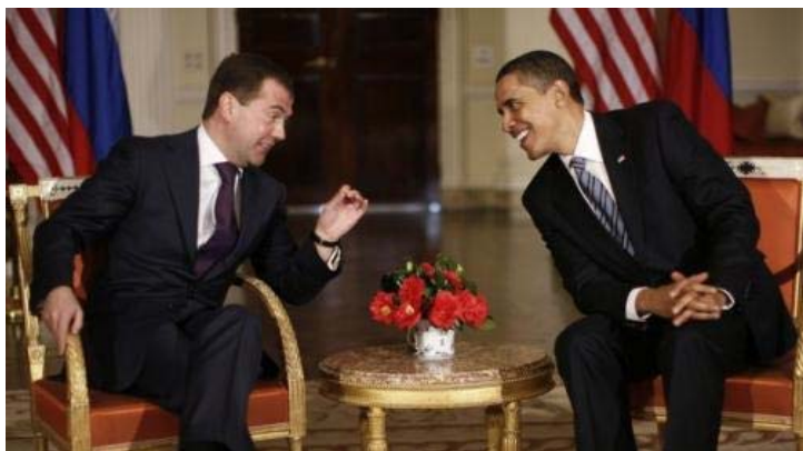
Rusijos prezidentas Dmitrius Medvedevas ir JAV prezidentas Barackas Obama

Rusai džiaugiasi, kaip gerai jų prezidentas Dmitrijus Medvedevas pasirodė G20 susitikime. Ir jie patenkinti, kad Medvedevas ir JAV prezidentas Barackas Obama sutiko, jog reikia mažinti ginkluotę .