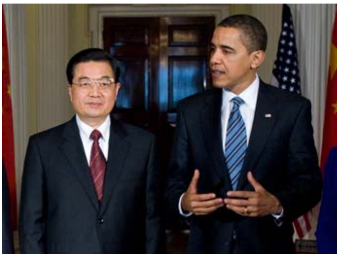
Kinijos prezidentas Hu Jintao ir JAV prezidentas Obama

Kinai didžiuojasi savo šalies augančia įtaka pasaulyje. Prezidentas Hu Jintao pakvietė Obamą apsilankyti Kinijoje ir Obama priėmė jo kvietimą. Jaučiama, kad santykiai tarp JAV ir Kinijos labiausiai nulems pasaulinės ekonomijos ateitį.