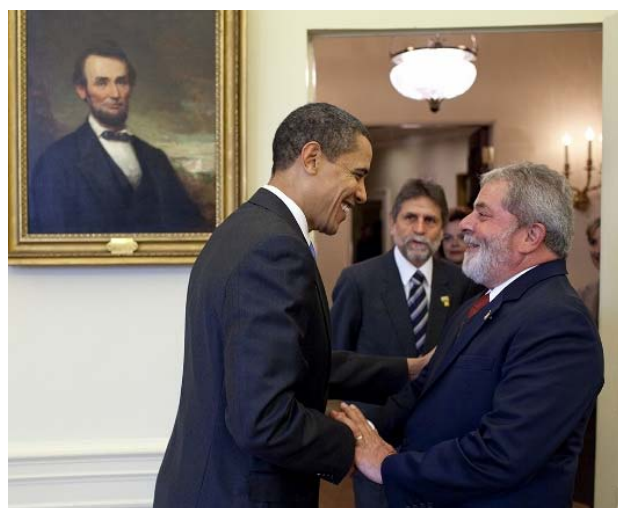
JAV prezidentas Obama ir Brazilijos prezidentas Lula da Silva susitinka Washingtone

Prancūzai džiaugiasi kad G20, sukurdamas Finansų stabilumo komitetą , perėmė finansų tvarkymą iš bankų. O tai lyg pirmas žingsnis į Naujojo pasaulio režimą .