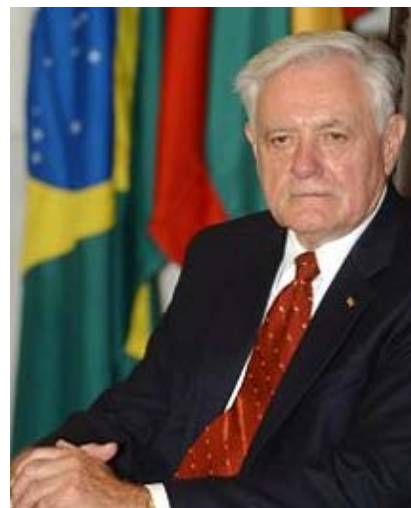
Dabartinis prezidentas Valdas Adamkus

valstybės padėtis, kur mes esame finansiškai, ir jeigu tuometu bus nustatyta, kad kito kelio nėra, kad daugiau suveržti diržo neįmanoma, tada pritariu, kad nebūsime pirmieji, kurie prašome tarptautinių institucijų palengvinti mums išbristi iš esamos krizės.