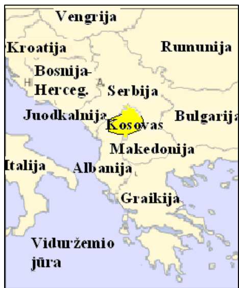
Kosovas ir jo kaimynės

Jau metus NATO treniruoja Kosovo karius ir padeda ten palaikyti tvarką. NATO tarpe yra 36 lietuviai. Tačiau Lietuvos dalyvavimas šioje misijoje greit baigsis. Kitos šalys taip pat svarsto galimybę trauktis iš NATO misijų Kosove. Ar Kosovo padėtis stabilizavosi? O gal ekonominė krizė priverčia karius palikti Kosovą? Ką tu manai?