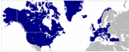
NATO narės pažymėtos tamsiai mėlyna spalva

NATO: (Šiaurės Atlanto Aliansas) karinė sąjunga; North Atlantic Treaty Organization