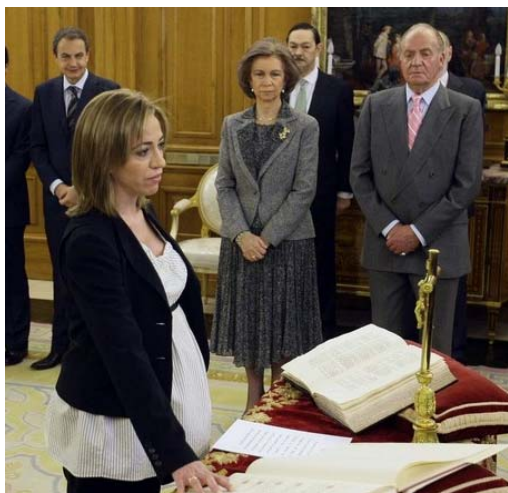
Ispanijos Saugumo ministrė Karme Chacón

Anglija taip pat dėl ekonominių priežasčių nori sumažinti savo štabą Kosove ir tariasi su kitom NATO narėm kaip tai padaryti. Švedija taip pat svarsto, kaip galėtų dėl ekonominių priežasčių mažinti štabą Kosove.