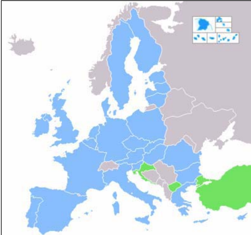
Europos sąjunga: narės pažymėtos mėlynai, kandidatės – žaliai

Europos sąjunga: Europos Sąjunga (sutrumpintai ES) yra dvidešimt septynių valstybių ekonominė ir politinė bendrija. Jai gali priklausyti tik Europos valstybės. Pirmininko pozicija rotaciniu būdu eina iš vieno krašto į kitą kas šešis mėnesius. ES narės padeda viena kitai piniginiiais ir kitais būdais.