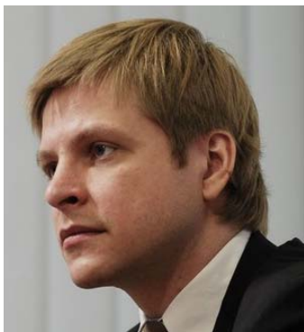
Teisingumo ministras Remigijus Šimašius

korupciją Lietuvoj. Ar jo planas geras? Ką tu manai?