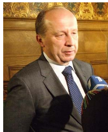
Ministras pirmininkas Andrius Kubilius

Šimašius galvoja, kad skaidrumas padės užtikrinti, kad valdininkai nenaudoja piliečių pinigų savo naudai. Anot Šimašiaus, tai padės užtikrinti valdininkų „veiklos skaidrumą, kontrolę ir atskaitomybę už panaudotus mokesčių mokėtojų pinigų.“