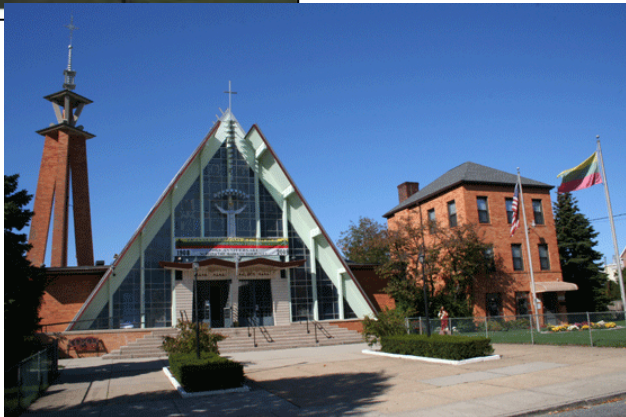
New Yorko Maironio lituanistinė mokykla