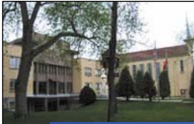
Čikagos lituanistinė mokykla

Savaitgalinės mokyklos. Vienas būdas emigrantams vaikams išmokti apie Lietuvą – savaitgalinės lietuviškos mokyklos.