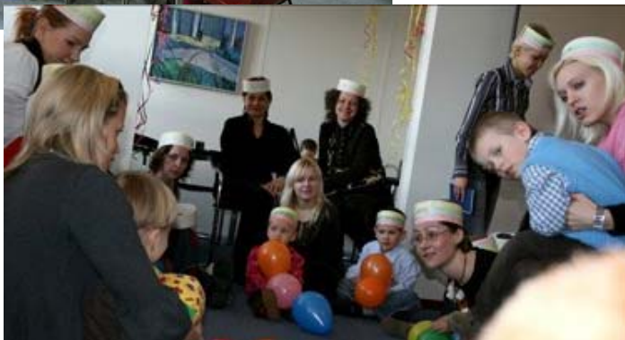
Šveicarijos lituanistinis darželis Ratas