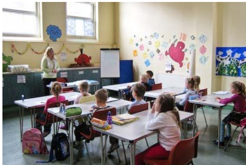
Klasė Londono Rasos lituanistinėje mokykloje