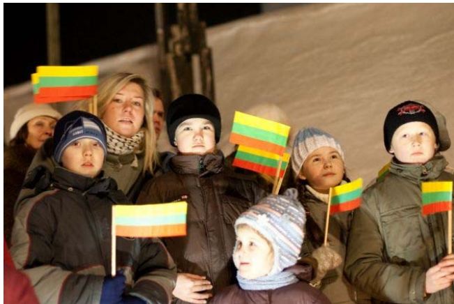
Iš svetur į Lietuvą grįžę vaikai (iš balsas.lt)

Vaikai, kurie grįžta į Lietuvą gyventi, dažnai sunkiai kalba lietuviškai. Ir jiems sunku integruotis į naują visuomenę. O mokyklos nepasiruošusios jiems padėti. Ką reiktų daryti?