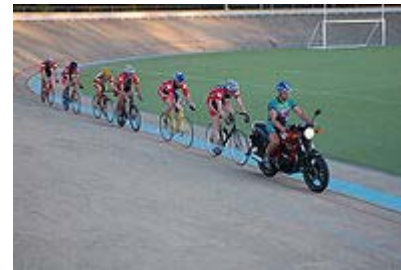
Pradžioj keirino rungtynių reikia laikytis užpakaly vado, kuris nustato greitį