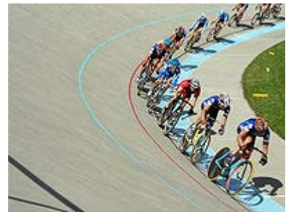
Nuožulnus trekas lauke - vyksta masinio starto lenktynės

siuvinėti: kūrybiškai dirbti su adata ir siūlais; embroidery, needlework