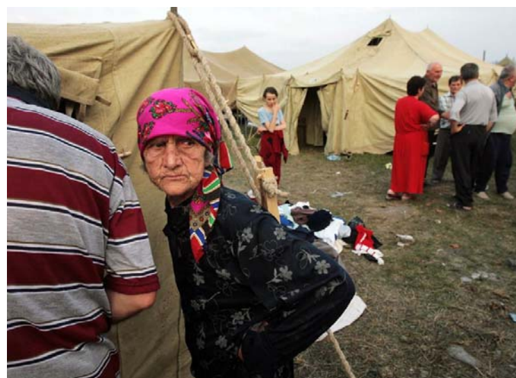
Tūkstančiai žmonių nebeturi namų ir turi gyventi palapinėse (iš blogs.denverpost.com )

pastatyti vėl ant kojų. Ir Lietuva pažadėjo per dvejus metus (2009-2010 metais) 3,400,000 litų paramą.