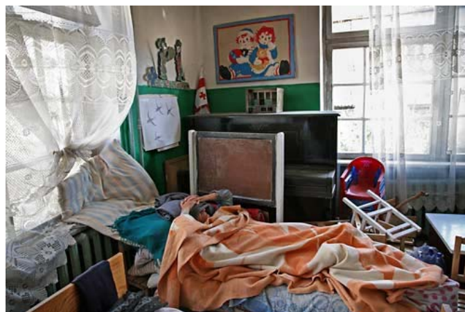
Gruzinė senutė, praradusi namus, miega vaikų darželyje

Spalio mėnesį įvyko susitikimas dėl Gruzijos, kuriame viso pasaulio kraštai pažadėjo duoti Gruzijai $4,500,000,000. Su tais pinigais gruzainai galės atstatyti sugriautus pastatus, pašelpti nuo karo pabėgėlius ir kraštą