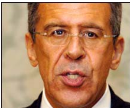
Sergejus Lavrovas

Praktiškai, tai reiškia, kad Gruzija negreit taps NATO nare. Tame pačiame susitikime buvo nuspręsta, kad, nepaisant padėties Gruzijoje, NATO turi atnaujinti derybas su Rusija. Šiuos sprendimus labiausiai nulėmė pasaulinė ekonominė krizė. Europa priklausoma nuo Rusijos dėl naftos. Jai reikia išnaudoti kiekvieną galimybę pokalbiams su Rusija tęsti.