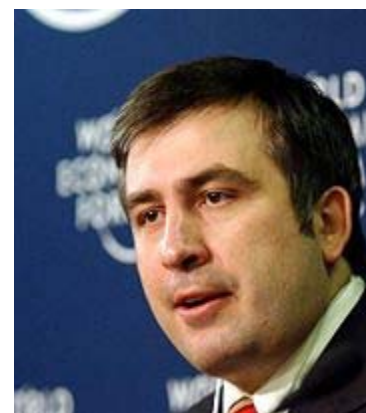
Gruzijos prezidentas Michailas Saakašvilis

ES pranešimas šiek tiek pakritikuoja ir JAV. Mat prezidentas George Bush Gruziją rėmė siūsdamas jiems ginklus. O Pietų Osetijoje jau nuo 1990 m. patuliavo rusų „taikos prižiūrėtojai.“ Gruzijos prezidentui Michailui Saakašvilui rūpėjo iš Gruzijos regionų juos išvartyti. JAV parama galėjo paskatinti gruzinus pulti rusus Pietų Osetijoje.