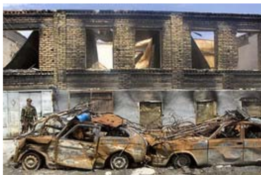
Karo padariniai dar šią vasarą

Prieš metus prasidėjo karas tarp Gruzijos ir Rusijos (žr. "Laikai vaikams" 2008 rugsėjo ir spalio numerius).