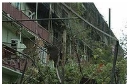
Karo padariniai - gyvenamo pastato griuvėsiai

Prieš metus prasidėjo karas tarp Gruzijos ir Rusijos (žr. "Laikai vaikams" 2008 rugsėjo ir spalio numerius).