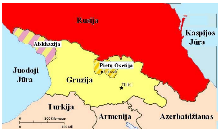
Gruzija, Abchazija ir Pietų Osetija

Europos sąjunga (ES) devynis mėnesius tyrinėjo, kas kaltas . Spalio mėnesį ji baigė tyrinėjimus ir paskelbė savo išvadas .