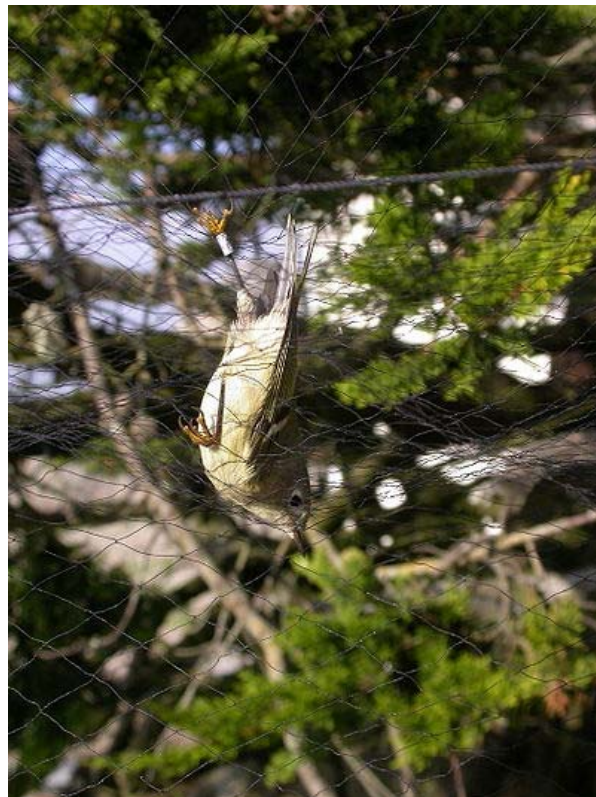
Paukštis, pagautas tinkle (jis jau turi žiedelį ant kojos)

Kaip ornitologai visą tai sužinojo? Jie turi sistemą, kuri vadinasi žiedavimas. Migruojančius paukščius pagauna tinkluose.