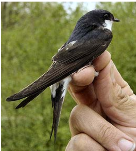
Kregždė - jos sveria mažiau negu unciją

Ornitologai visoje Europoje tyrinėja paukščių migravimą. Jie yra daug sužinoję. Pvz., jie žino, kad kregždės iš Lietuvos skrenda į Pietų Afriką.