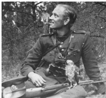
Adolfas Ramanauskas - Vanagas

Jonas Žemaitis – Vytautas , kartais vadinamas ketvirtuoju Lietuvos prezidentu. Gegužės 30, 1953 jo bunkeris buvo išduotas . Jis buvo suimtas gyvas, o lapkričio 26, 1954 sušaudytas kalėjime.