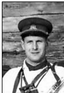
Aleksandras Grybinas – Faustas

Po 3 mėnesių kankinimo ryšininkė išdavė jo bunkerį. Po inirtingo pasipriešinimo prieš čekistus žuvo 1950 m. liepos 22 d. Ariogalos miške.