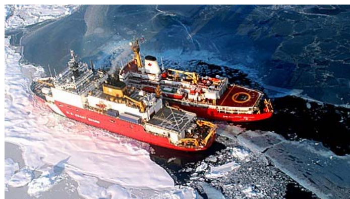
Amerika ir Kanada kartu tyrinėja Arktiką

Ką tu galvoji - kam turėtų priklausyti Arktika? Parašyk mums: redaktore@laikaivaikams.org