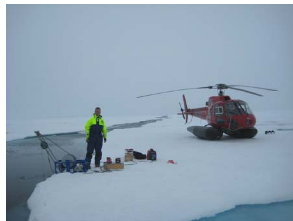
Švedija ir Danija vykdė jungtinę ekspediciją į Lomonosovo gūbrį

Valstybės bendradarbiauja tyrinėdamos Arktiką. Tai sutaupo pinigų ir laiko.