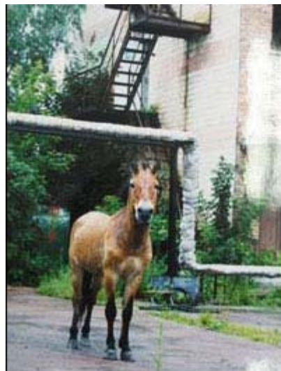
Przewalskio arklys Černobylyje

Taip pat prie Černobylio klesti barsukai , bebrai , stirnos, briedžiai, vilkai, ūdros ir lapės.