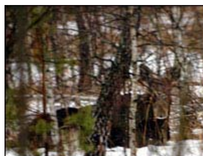
Briedis Černobylio miške

Taip pat prie Černobylio klesti barsukai , bebrai , stirnos, briedžiai, vilkai, ūdros ir lapės.