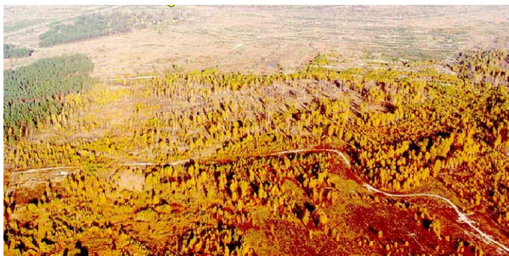
Parudavęs pušynas prie Černobylio

Ketrios kvadratinės mylios pušyno , kuris augo prie jėgainės, parudavo ir išmirė. Gyvuliai padvėso. Galvijai nebeužaugo, liko mažiukai. Žemė liko apnuodyta radioaktyvine medžiaga. Mokslininkai manė, kad daug, daug metų ten bus tik dykvietė .