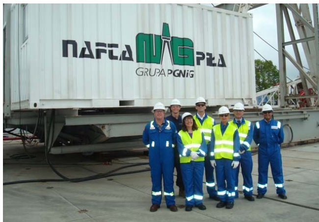
Lane Energy Poland (dalis ConocoPhillips) darbininkai Lenkijoje

Lane Energy Poland ir Schlumberger yra dvi skalūnų dujų grežimo firmos. Jos pastatė grąžtus ir šiuo metu gręžia dviejose vietose Lenkijoje. Spalio mėnesį jos praneš Lenkijos vyriausybei , ką rado - kiek dujų toj vietoj, kur gręžė, ir kaip lengva bus jas išgauti.