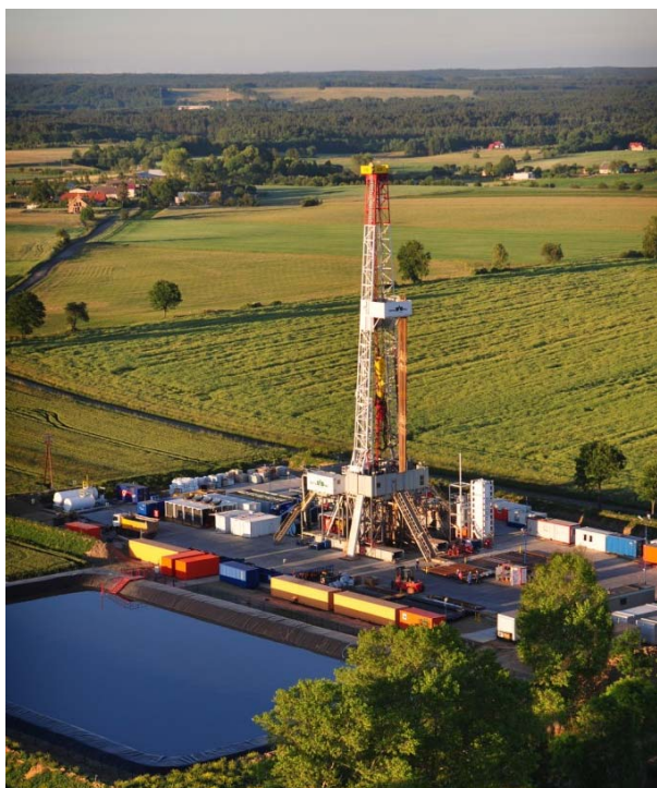
Lane Energy Poland tiriamasis grąžtas Lenkijoje

Produkcijos irangos pastatymas reikalauja daug laiko ir pinigų. Dujas išgauti naudojimui bus galima ne anksčiau, kaip po 10-15 metų. Tuo tarpu, Lenkija turės pirkti dujas iš Rusijos.