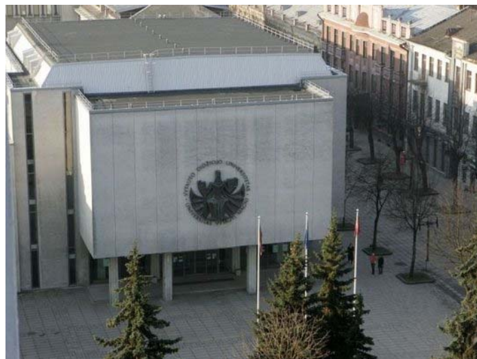
Vytauto didžiojo universitetas Kaune

Vyresnieji jau seniai gali mokytis lietuvių kalbos ir kultūros Kaune ir Vilniuje. Rugsėjo mėnesį daugiau nei penkiasdešimt studentų iš Europos, Pietų Korėjos, Brazilijos ir Amerikos mokėsi lietuvių kalbos Kaune, Vytauto didžiojo universitete (VDU).