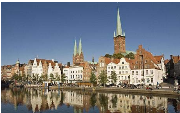
Liubeko miesto vaizdas (Vokietijoje)

Spalio 2 d. penkios mokytojos iš Lietuvos pradėjo mokytį lietuvių kalbą Liubeko miesto pradinėse mokyklose . Ir dar penkios mokytojos jiems pradėjo mokytį Lietuvos istoriją ir kultūrą (vokiškai).