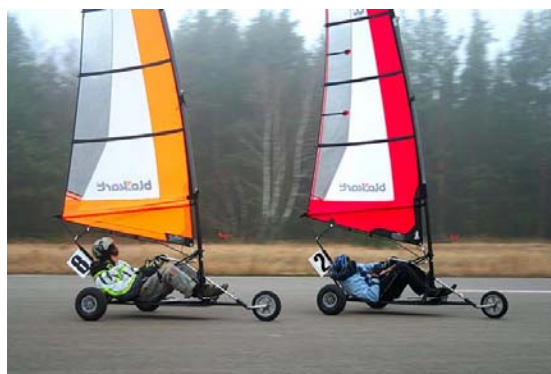
Pabaltijo vėjaračių čempionatas

Šis sportas ypatingai mėgstamas Didžiojoje