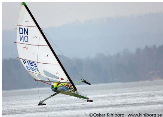
Buriavimas ledrogėmis ant Rekyvos ežero Šiauliuose

Ledrogėmis galima važiuoti ir ant sausumos. Kai nebėra ledo, tik nuimi pačiūžas ir įtaisai ratukus: štai ir vėjaračiai! Tik ratukais važiuojant greičiai mažesni.