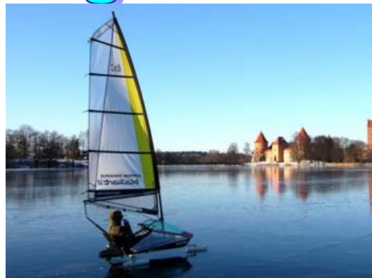
Ledrogės prie Trakų pilies

Buriavimas ledrogėmis vadinamas ekstremaliu sportu . Ledrogėmis galima pasiekti 50 mylių per valandą greitį. Rekordinis greitis yra 84 mylios per valandą, pasiektas ant Wallenpaupack ežero Pensilvanijos valstybėje. Dėka greičio, buriuotojai dėvi ypatingą apsaugą.