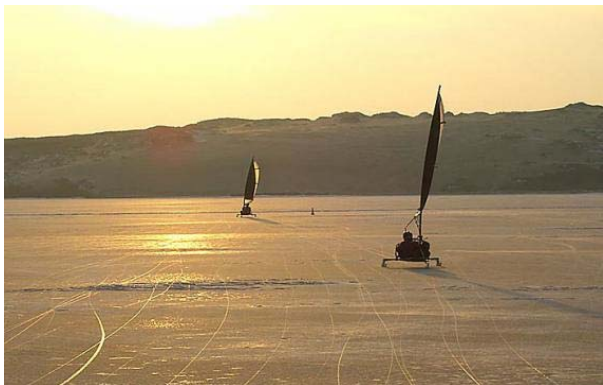
Ledrogės ant Kuršių marių