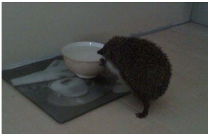
Ežiukas Kliunka Šanterioių virtuvėje

Ūkmergėje vasario mėnesio gale per anksti atsibudo ežiukas . Jį surado iš mokyklos grįžę Šanterioių vaikai. Jis bėgiojo jų kieme ant lentų krūvos. Vaikai stebėjosi, kaip greit jis bėginėjo, nors lauke buvo baisiai šalta.