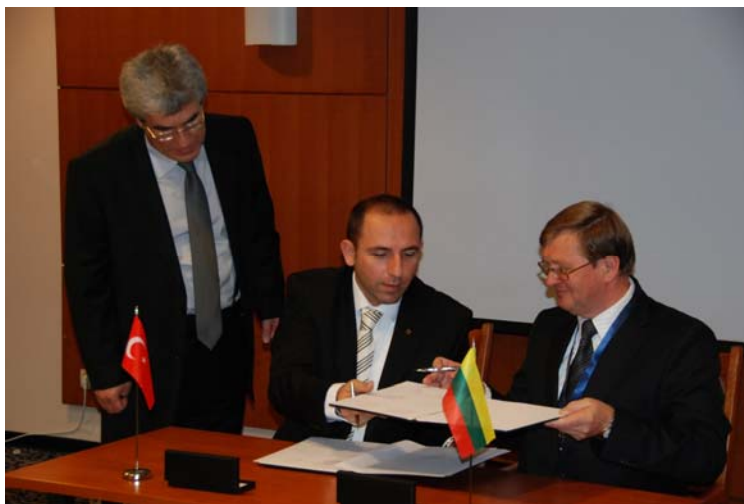
„Lietuvos geležinkeliai “ ir Turkijos asociacijos „MUSIAD“ atstovai pasirašo sutartį

Balandžio 3 d. Turkija pasirašė sutartį su Lietuva. Sutartyje buvo sutarta, kad Turkija praplės Vikingo kursavimą iš Istanbulo į Siriją, Iraną ir Iraką. Tuo būdu, Baltijos šalys bus sujungtos su Artimaisiais rytais .