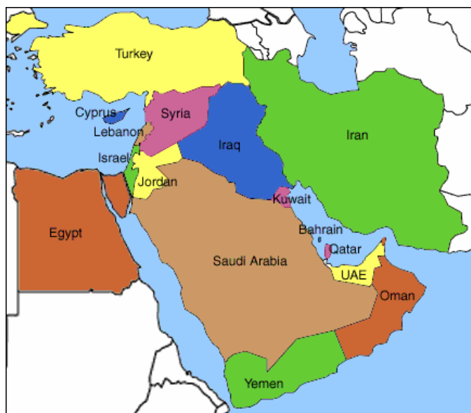
Iš Turkijos Vikingas kursuos į Siriją, Iraką ir Iraną

Vikingas gerai atlieka transporto paslauga . 2009 m. Europos transporto asociacija Vikingui paskyrė apdovanojimą „Geriausias intermodalinis transportas ir krovinų vežimo nuo A iki B paslaugų integracija“.