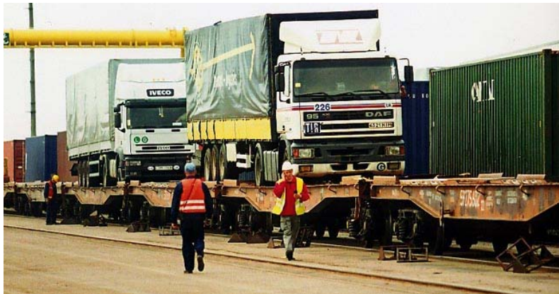
Šaudyklinis traukinys „Vikingas“

2003 m. lietuviai ir ukrainiečiai pastatytė šaudyklinį traukinį „Vikingas“. Jis krovinius veža pigiau ir greičiau, negu kiti traukiniai. Jis susideda iš platformų, nuo kurių rieda sunkvežimiai arba yra nukeliamos sunkvežimių priekabos . Labai lengva priekabą nukelti nuo platformos ir prikabinti prie sunkvežimio. (Žr. „Laikai vaikams“ 2008 spalio numerį.)