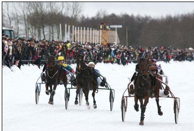
Žiūrovai stebi lenktynes ant ledo (iš 15min.lt)

Jeį nėra per daug sniego, lenktynės vyksta ant ledo. O jei ant ledo neįmanoma lenktyniauti, lenktynės vyksta ežero pakrantėje.