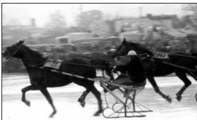
Taip atrodė žirgų traukiamos rogės 1988 m.

Prieš lenktynes buvo paradas, kuriame dalyvavo devyni raiteliai, pasibalnoję seniausios lietuviškos veislės žirgus - žemaitukus. Tai buvo tie patys žemaitukai, kurie beveik 1,000 mylių nukeliavo nuo Senųjų Trakų iki Juodosios jūros (žr. "Laikai vaikams" sausio numerį ). Žiūrovai jiems garsiai plojo ir šaukė.