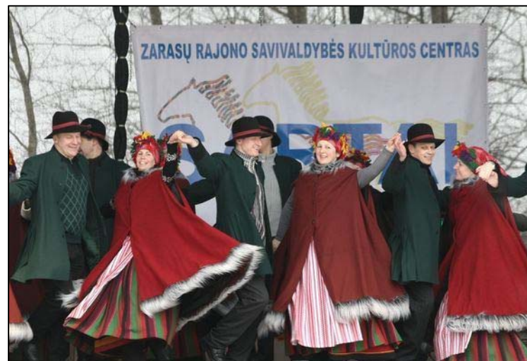
Žiūrovus džiugino ir kitos programos (iš 15min.lt)

Šiom dienom lenktyniauja ne rogėmis, o vežimėliais (iš 15min.lt)