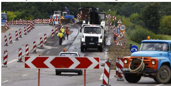
Nuolatinės spūstys prie Karalienės Luizos tilto

Tiltas buvo pastatytas 1907 metais, kai žmonės dar važinėjo vežimais, ne mašinom. Dabar Karalienės Luizos tiltas yra žymiai per mažas transportui, kuris nuolat vyksta tarp Lietuvos ir Kaliningrado.