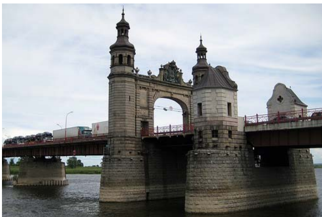
Karalienės Luizos tiltas tarp Sovetsko ir Panemunės

Sovetsk (seniau vadinamas Tilže) yra miestas ant Nemuno kranto Kaliningrade, Rusijoje. O Panemunė yra miestas ant Nemuno kranto Lietuvoje. Tuos du miestus jungia senas tiltas vadinamas Karalienės Luizos tiltu.