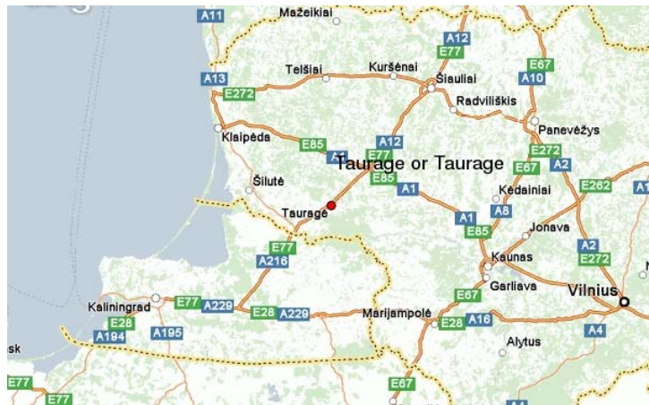
Lietuvos keliai - E77 jungia Kaliningradą, Sovetską, Tauragę, Rygą

Spalio pradžioj Lietuva ir Rusija susitarė šalia seno tilto statyti naują tiltą per Nemuną. Naujasis tiltas Rusijai svarbus nes labai pagerins susisiekimą tarp Rusijos ir Kaliningrado srities. O Lietuvai svarbus nes sudarys sąlygas aktyvesnei prekybai su Rusija. Ir dėka projekto pagerės Panemunės gyventojų gerovė, nes mašinos nebevažiuos per jų miestelio centrą.