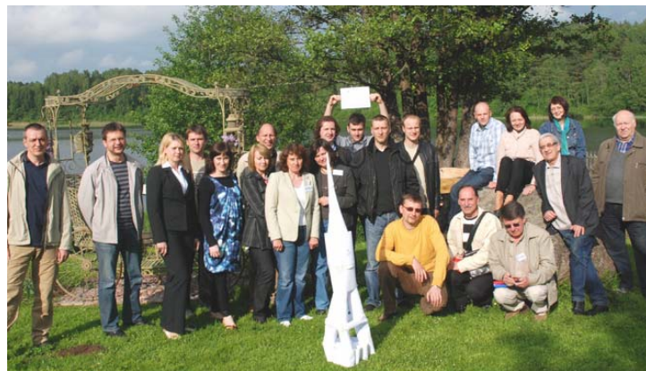
Dalis „Eksma“ darbuotojų Vilniuje

Dar vienas naujas „Ekspla“ lazeris beveik laimėjo „Prism Award“ premiją fotonikos kategorijoje. Tai lazeris, kuris naudojamas JAV bendrovės „Anasys Instruments“ įrenginyje.