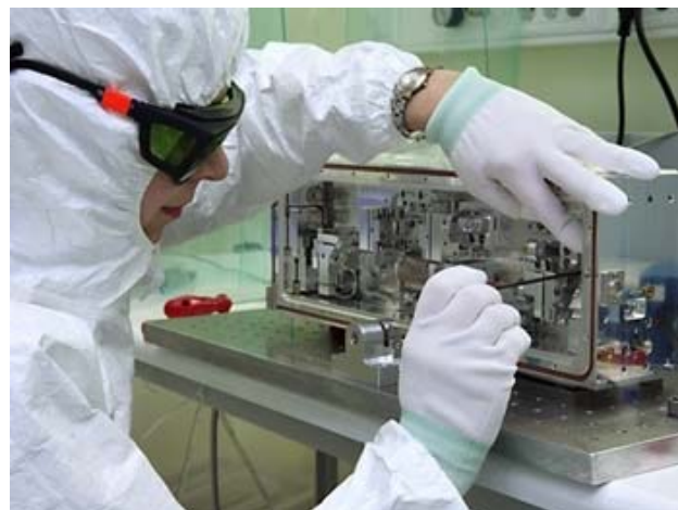
Gaminamas lazerinis įrenginys

Yra ir kitų įmonių Lietuvoje, kurios gamina ir kuria lazerius, pvz., „Šviesos konversija“ ir „Eksma“. Iš tiesų, Lietuva tvirtai pirmuoja pasaulyje lazerinės technologijos srity.