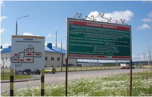
Baltarusijos Astravo atominės elektrinės statybų aikštelė

Baltarusija stato atominę elektrinę 25 mylias nuo Vilniaus. Jau daugiau, nei du metus Lietuva prašo, kad būtų pakeista elektrinės vieta, bet veltui . Todėl dabar Lietuva paprašė UNESCO pagalbos padėti pakeisti Baltarusijos planus.