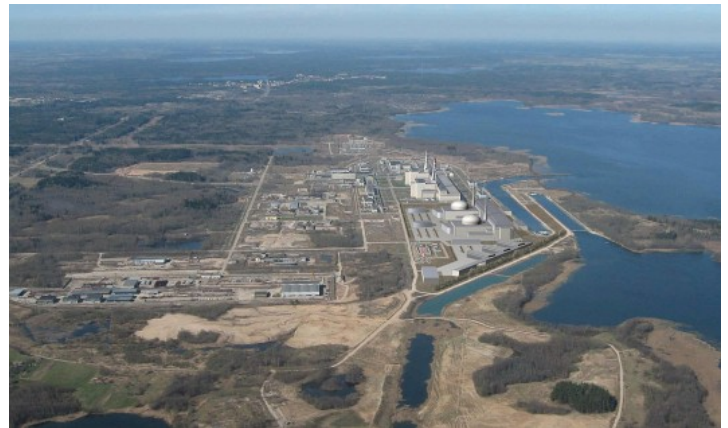
Visagino elektrinės projektas arti Žeimenos upės

Visagino elektrinė pumpuos naudotą vandenį į Žeimenos upę, kuri įteka į Nerį. 2001 m. tame rajone įvyko 2,1 stiprumo žemės drebėjimas. Taigi, Lietuvai sunku priešintis Astravo elektrinės statybai. Tačiau gali reikalauti daugiau informacijos (kurios negauna).