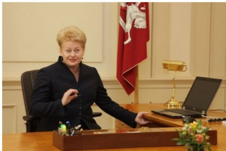
Prezidentė Dalia Grybauskaitė

Šimašius aiškina, kad 2010 m. korupcijos suvokimo indeksas pakilo iki 5 todėl, kad buvo įvestas skaidrumas į viešuosius pirkimus.