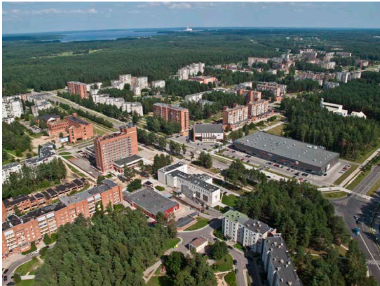
Visaginas iš viršaus

Dalis Lietuvos energetinės nepriklausomybės strategijos yra atominė elektrinė . Ją statys Visagine.