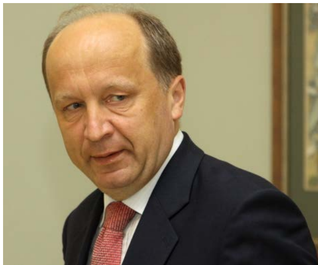
Lietuvos Ministras pirmininkas Andrius Kubilius

O Hitachi firma, anot Kubiliaus, yra geriausia partnerė saugos požiūriu.