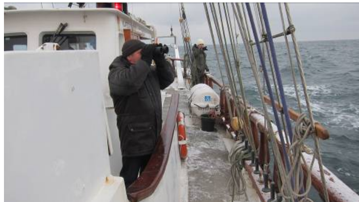
Ornitologas stebi paukščius burlaivyje Brabander

KU laivai vykdo įvairius mokslinius tyrimus. Pvz., žiemą laivas Brabander išvežė ornitologus iširti paukščių susibūrimo vietas Baltijos jūroje. Surinkti duomenys bus naudojami vertinti, kokį poveikį paukščiams turės planuojamas vėjo jėgainių parkas Baltijos jūroje.