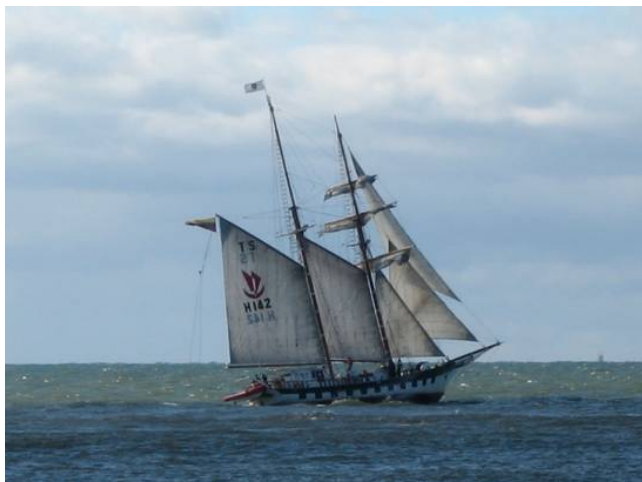
Klaipėdos u-to pagrindinis mokslinis laivas - burlaivis Brabander

Kad studentai galėtų mokslinius tyrimus vykdyti ne tik klasėse, bet ir jūroje, KU turi tris laivus. Pagrindinis jų – burlaivis Brabander.