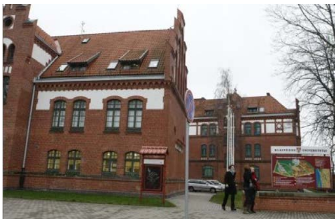
Klaipėdos universitetas

Kaip jūrinė valstybė, Lietuva turi universitetą, kuriame dėsto oceanologiją , hidrologiją , ichtiologiją , bei kitus jūros mokslus. Tai yra, būtent, Klaipėdos universitetas (KU).