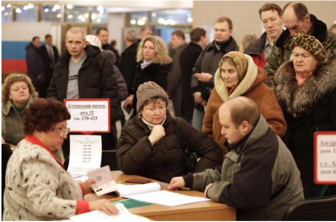
Balsuotojai laukia eilės per Rusijos prezidentinius rinkimus

Kovo pradžioj Rusijos piliečiai balsavo už naują prezidentą.