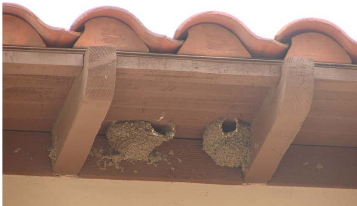
Kregždžių lizdai namo šelmenyse

Ji vadinasi šelmenine nes suka lizdus pastatų šelmenyse .