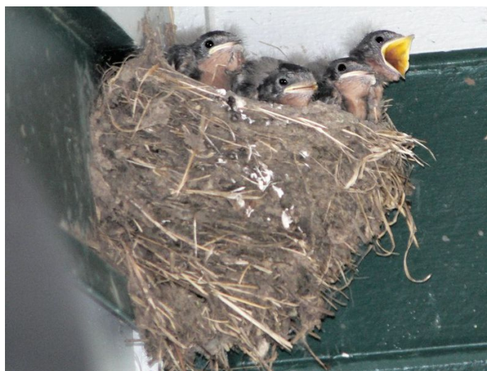
Šelmeninės kregždės mažyliai prašo būti maitinami

O kregždės pripratusios prie žmonių. Jei būsi ramus, kregždė leis tau pamatyti, kaip ji maitina mažylis.