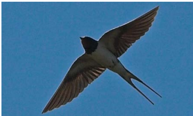
Šelmeninė kregždė (iš wikipedia)

Šelmeninę kregždę pažinsi iš ilgos, gilos uodegos iškirptės . Ją pažįsta beveik visas pasaulis. Iš Lietuvos spalio mėnesį kregždės skrenda į Pietų Afriką.