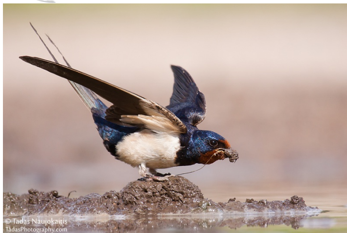
Renka šlapią purvą lizdui

Minta skrendančiais vabzdžiais . Todėl dieną ji nuolat skraido.