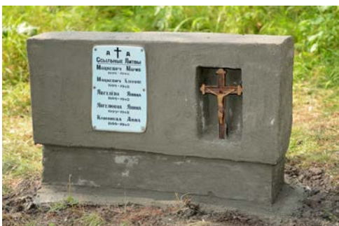
Sutvarkytas paminklas

Antra ekspedicija keliavo į Chakasijos respubliką.