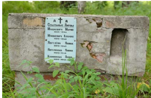
Taip atrodė paminklas 2011 m.

Altajaus Kutašo kaime jau nebėra lietuvių. Bet ten stovi paminklas mirusiems lietuviams. 2011 m. ekspedicijos nariai pastebėjo, kad tas paminklas visai apgriuves. Jie pasiryžo ten vėl nuvykti ir paminklą sutvarkyti.