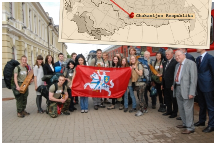
Su ekspedicijos nariais atsiseivkina prie traukinio