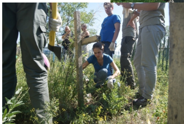
Ką galvoji apie misijas į Sibirą? Ar

tu norėtum jose dalyvauti? Paaiškink. Parašyk mums: redaktore@laikaivaikams.org