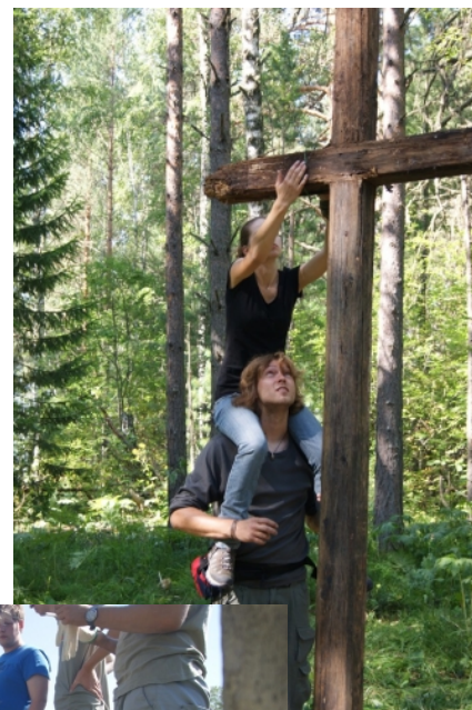
ir tvarkė kapines (iš misijasibira.lt )