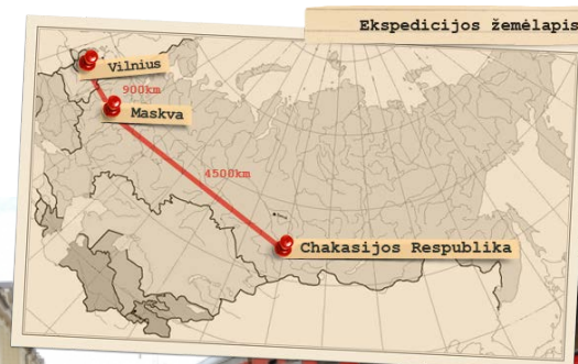
Iš Lietuvos į Chakasiją (iš misijasibiras.lt )

Antra ekspedicija keliavo į Chakasijos respubliką.