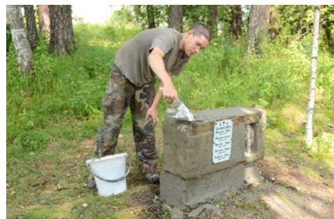
2012 ekspedicijos narys tvarko paminklą