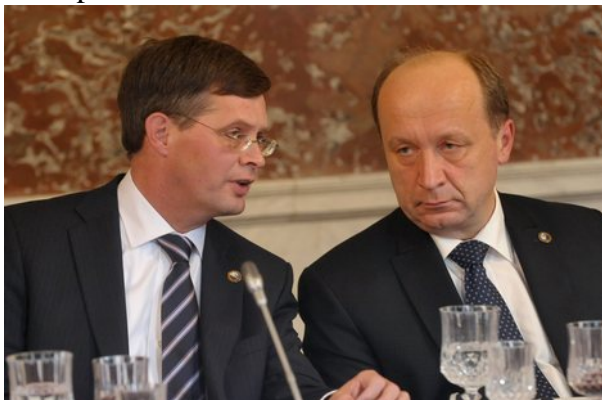
Buvęs Nyderlandų Ministras pirmininkas J.P. Balkenende ir Lietuvos Ministras pirmininkas Andrius Kubilius

Apdovanojimą Kubiliui įteikė buvęs Nyderlandų Ministras pirmininkas Jan Peter Balkenende.