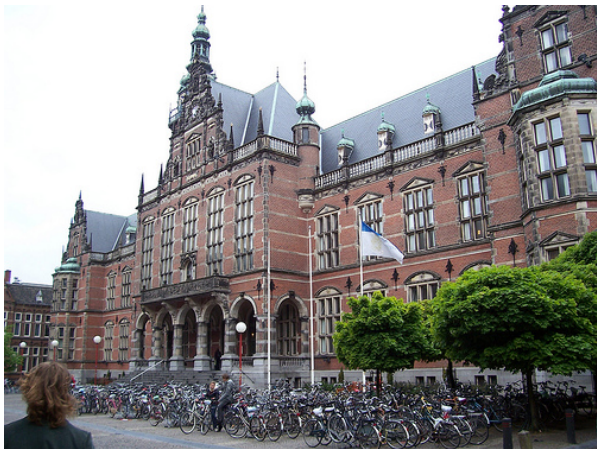
Erasmuso u-tas Roterdame, Nyderlanduose

Šią premiją skiria Roterdamo Erasmus universiteto Ekonomikos fakulteto asociacija (EFR). Ją duoda kasmet už ypatingus pasiekimus politikos, ekonomikos ir visuomenės gerovės srityse.