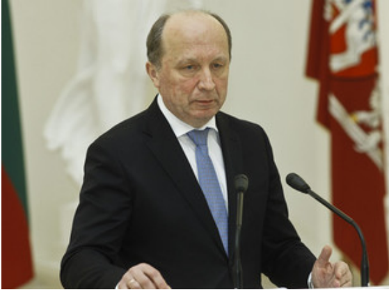
Lietuvos Ministras pirmininkas Andrius Kubilius

Lietuvos Ministrui pirmininkui Andriui Kubiliui buvo paskirta 2012 „Pasaulio vado“ premija. Tai prestižinė premija. Lietuviai didžiuojasi, kad tokios mažos tautos politinis vadovas buvo taip pagerbtas.