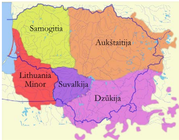
Dzūkija – Lietuvos pietryčiuose

vėžliai pradeda išnykti . Todėl jie yra saugomi, įtraukti į Raudonąją knygą . Mat, baliniams vėžliams pradeda pritrūkti tinkamų gyvenviečių. Jiems reikia pelkėtų vietų, kur gali rasti maisto, ir saulės šildomos žemės, kur gali šildytis ir dėti kiaušinius. Mat vėžliai yra šaltakraujai – jiems ir jų kiaušiniams labai reikia saulės šilumos.