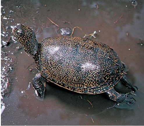
Balinis vėžlys plaukioja baloje

Ar žinote, kad Lietuvoje yra vėžlių ? Taip, jų yra, bet tik viena veislė . Jie vadinasi „baliniai vėžliai“ nes gyvena balose , pelkėtose vietose.