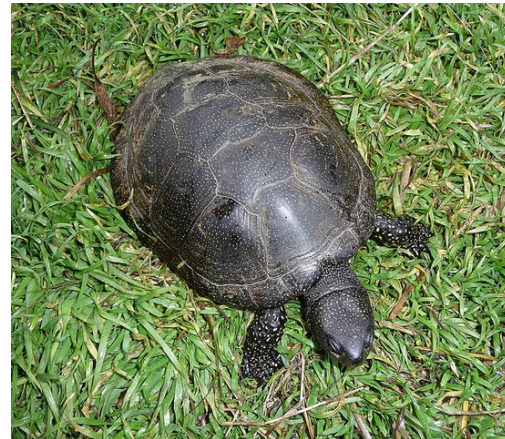
Balinis vėžlys šildosi saulėje

Jaunikliai zoologijos sode bus auginami iki trejų metų amžiaus. Tada jie bus išleidžiami į gimtąsias vietas. Taip lietuviai tikisi išgelbėti šią nykstančią gyvūnų veislę.