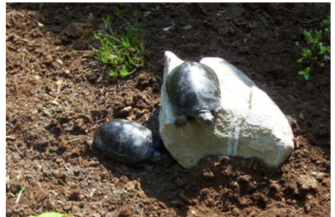
Kiaušinius baliniai vėžliai užkasa po šilta žeme ir patys ten šildosi (iš gamtininkai.lt )

Ar tau įdomu skaityti, kaip lietuviai stengiasi išsaugoti nykstančias gyvūnų veisles? Parašyk mums: redaktore@laikaivaikams.org