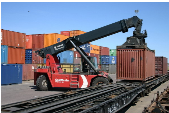
Klaipėdoje iš laivų iškrauti konteineriai kraunami ant Vikingo

Prie Vikingo projekto prisideda vis daugiau valstybių. Jau anksčiau į projektą buvo ištraukusi Bulgarija . Šį mėnesį prie jo prisidėjo ir Rumunija .