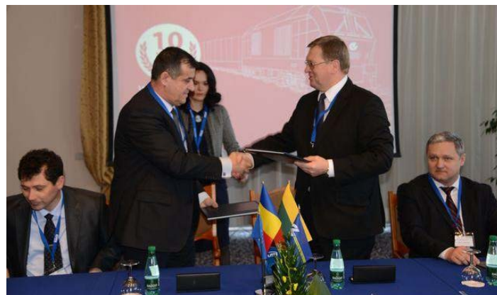
Rumunijos geležinkeliai prisijungia prie Vikingo projekto

Iki šiol traukinį reikėdavo keltu kelti per Juodąją jūrą. O tai yra brangu. Kaip, manai, Rumunijos prisijungimas prie Vikingo projekto padės sutaupyti pinigų? Parašyk mums: redaktore@laikaivaikams.org