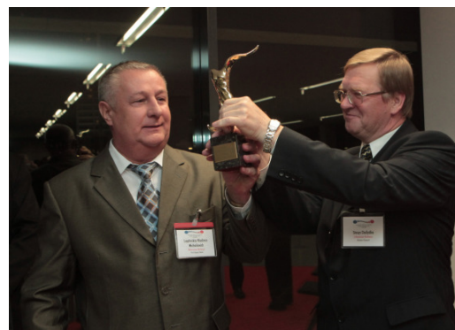
Europos Intermodalinės Asociacijos apdovanojimas

Į traukinį yra kraunami konteineriai , kurie iš Skandinavijos bei Vakarų Europos šalių atgabenami jūrų transportu į Klaipėdos uostą. Konteineriai vežami į Baltarusiją, Ukrainą, Artimuosius Rytus, Kaukazą ir atgal.