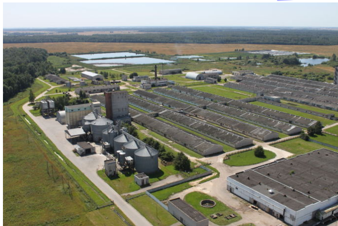
Biojėgainė prie Panevėžio.

Lietuva ieško naujo elektros šaltinio. 2014 m. pradžioje Lietuvoje pradės veikti pirmoji šalies biojėgainė . Ji gamins elektrą iš gyvulių mėšlo .