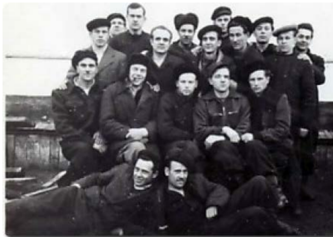
Lietuviai Vorkutos sukilimo organizatoriai ypatingajame baudžiamajame lageryje Nr. 62. 1955 m.

Sukilimo vadai išnaudojo naują savo padėtį. Atsiradę visi kartu vienoje vietoje, jie pajuto, kad gali efektingiau veikti.