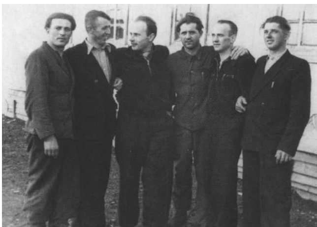
Vorkutos lagerio politiniai kaliniai – partizanai ir jų rėmėjai (iš partizanai.org )

1948–1949 m. į Vorkutą buvo ištremti daug Lietuvos politinių kalinių – partizanų ir jų rėmėjų. 1953 m. jie suorganizavo didelį streiką – net 8,700 kalinių atsisakė dirbti.