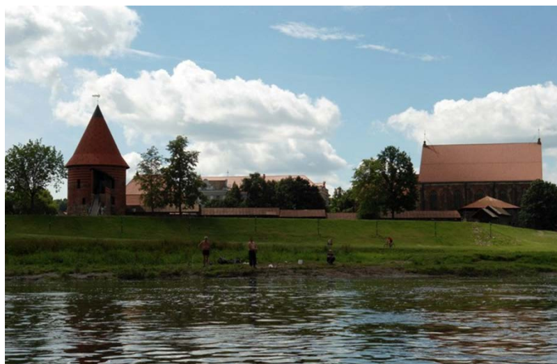
Pilis ant Nemuno

Jie plaukė upėmis ir ežerais daugiau, nei 450 mylių. Kelionė užtruko mėnesį. Gali daugiau pasiskaityti: www.vandenukeliais.lt O gal tau būtų įdomu atlikti panašų žygį?