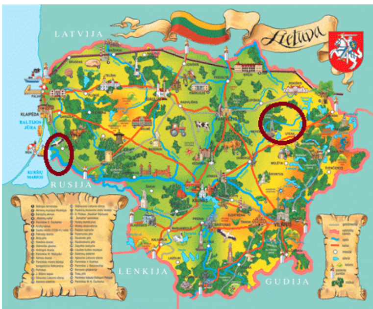
Ventos ragas kairėj, Aukštaitijos nacionalinis parkas dešinėj – ar matai, kuriom upėm galėjo jie skersai Lietuvą nuplaukti?

Tarp Kauno ir Jurbarko jie matė piliakalnių ir pilis, kurios dvelkė viduramžiais. Ši dalis Nemuno buvo viena įdomiausių vietų jų kelionėje.