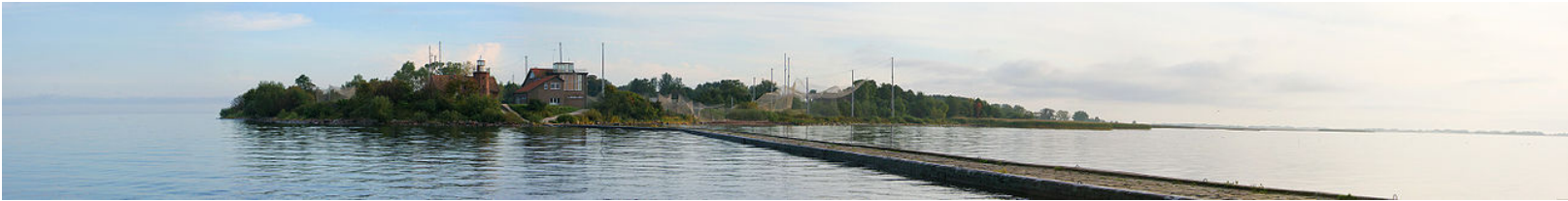
Ventės ragas

Ventos ragas: pusiasalis (iškišulys) prie Kuršių marių . Labiausiai žinomas dėl jame įkurtos praskrendančių paukščių žiedavimo stoties (žr. "Laikai vaikams" 2012 spalio numerį ).