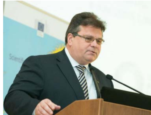
Lietuvos Užsienio reikalų ministras Linas Linkevičius

pirmininkauja Europos Sąjungai (ES). Ji labai stengiasi įkurti Rytų partnerystės programą. Gal Rusija jaučia, kad Rytų partnerystės programa izoliuotų ją nuo Ukrainos, Armėnijos ir kitų programos kandidačių. Gal dėl to ji Lietuvą baudžia .