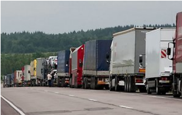
Eilė Lietuvos sunkvežimių laukia pravažiuoti pro Rusijos muitinę

Prie vieno munitinių stovi net 150 ar daugiau sunkvežimių iš Lietuvos. Muitinės praleidžia tik 10 Lietuvos sunkvežimių į dieną. Tai reiškia, kad vieniems reikės laukti dvi savaites ar daugiau.