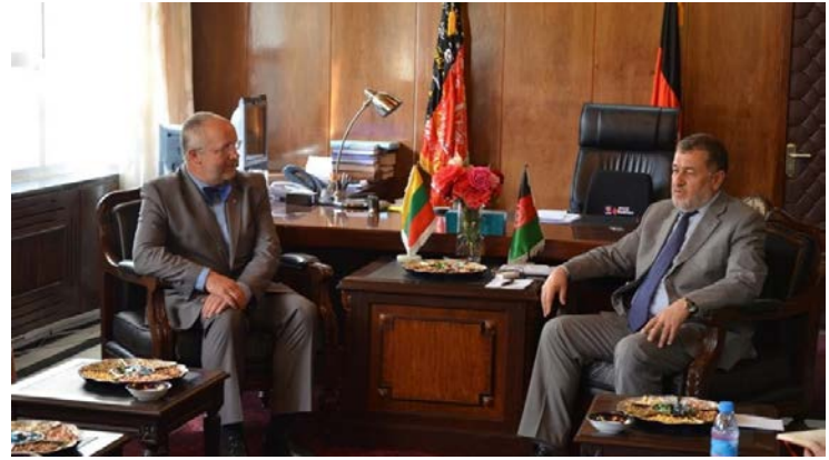
Lietuvos krašto apsaugos ministras Juozas Olekas ir Afganistano gynybos ministras Bismillah Khan Mohammadi.

Lietuvos vyriausybė nori toliau bendradarbiauti su jais. Ji nori būti aktyvi jų sąjungininkė, kad jie neužmirštų Lietuvos, jei kada jai reikėtų pagalbos. Lietuvos vyriausybė nutarė sukurti naują misiją Afganistane.