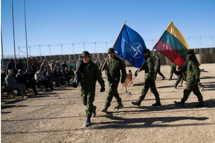
Lietuviai Afganistane bendradarbiauja su NATO sąjungininkais.

2013 m. vasarą lietuviai atsisveikino su afganistaniečiais Goro provincijoje ir grįžo namo. (žr. „Laikai vaikams“ 2013 rugsėjo numerį .) Pasiliko Lietuvos sąjungininkai – NATO , ES ir JT – su kuriais Afganistane daug metų bendradarbiavo Lietuva.