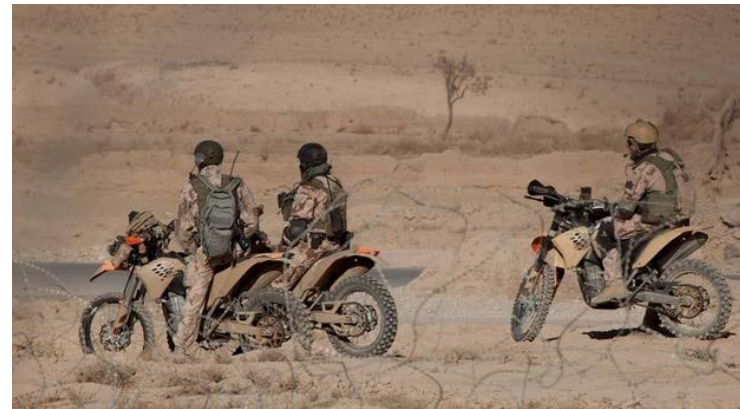
Talibanas nemėgsta, kad lietuviai naudoja motociklus – jie labai efektyvūs.

Lietuva dabar turi nutarti, kur ji vykdys šią misiją. Ji gali savo žmones siųsti į Mazarį Šarifą šiaurėje, kur vadovauja Vokietija. Ten pajėgas žada siųsti kitos Baltijos ir Šiaurės Europos valstybės . Arba ji gali savo žmones siųsti į pietus ir rytus, kur vadovauja JAV .