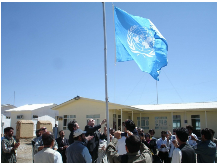
JT atidarė misiją Gore, kuri gynė lietuviai.

Lietuvos vyriausybė nori toliau bendradarbiauti su jais. Ji nori būti aktyvi jų sąjungininkė, kad jie neužmirštų Lietuvos, jei kada jai reikėtų pagalbos. Lietuvos vyriausybė nutarė sukurti naują misiją Afganistane.