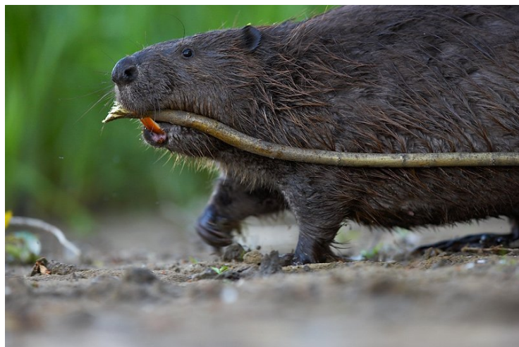
Bebras neša maistą į savo maisto sandėlių.

sluoksnį. Be to turi storą kailį. Jie pasistato buveines prie vandens. Ten įsirengia maisto sandėlius .