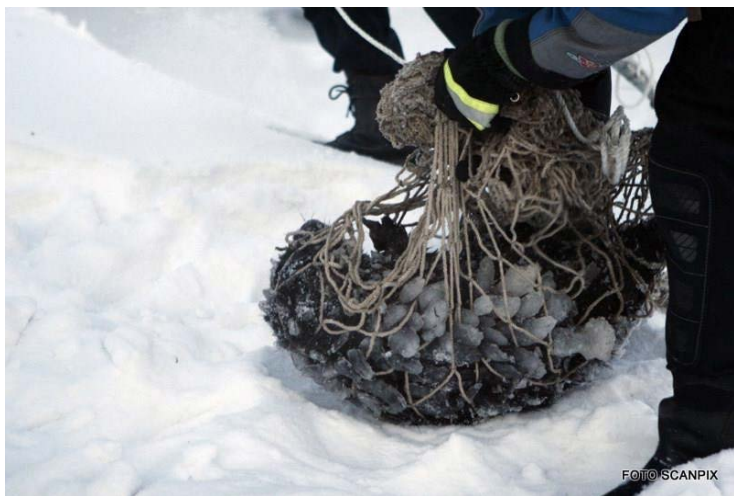
Rado sušalusį bebrą ant Neries kranto.

Vilniuje žmonės pastebėjo sušalusį gyvūnelį ant Neries kranto. Jo kailis buvo apaugęs dideliais ledo gabalais. Iškvietė ugniagesius . Jie stačiais Neries šlaitais užnešė gyvūnelį ir išvežė į Gyvūnų globos namus Kaune. Tas gyvūnelis buvo bebras .