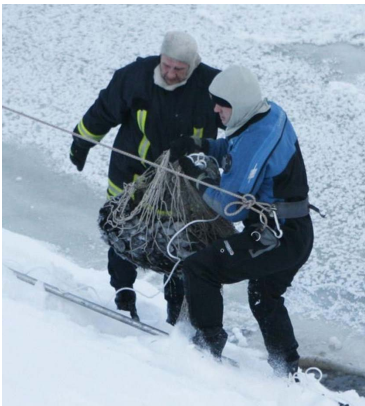
Ugniagesiai gelbsti bebrą Vilniuje.

Vilniuje žmonės pastebėjo sušalusį gyvūnelį ant Neries kranto. Jo kailis buvo apaugęs dideliais ledo gabalais. Iškvietė ugniagesius . Jie stačiais Neries šlaitais užnešė gyvūnelį ir išvežė į Gyvūnų globos namus Kaune. Tas gyvūnelis buvo bebras .