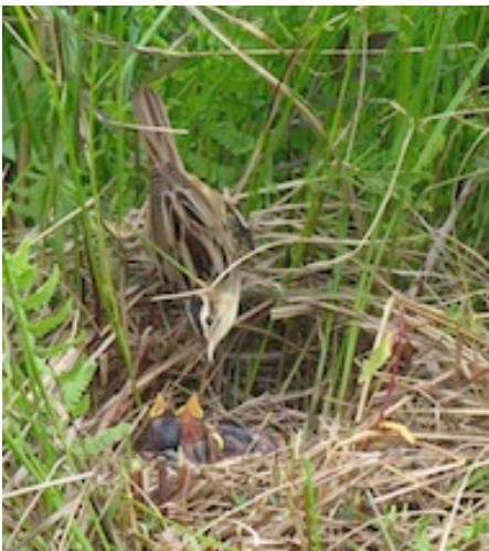
Meldinė nendrinukė maitina mažylius lizde – įdubime žemėje .

Meldinė nendrinukė yra vienas rečiausių šlapių pievų paukščių Europoje. Jie peri tik keturiose šalyse: Baltarusijoje , Lenkijoje , Ukrainoje ir Lietuvoje .