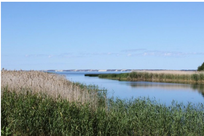
Pelkėta Kuršių marių pakrantė , kurią mėgsta meldinė nendrinukė .

Jie pastebėti Žuvinte , rytinėje Kuršių marių pakrantėje ( Kliošių kraštovaizdžio draustinyje ) ir Nemuno deltoje . Nendrinukė įrašyta į Lietuvos raudonąją knygą .