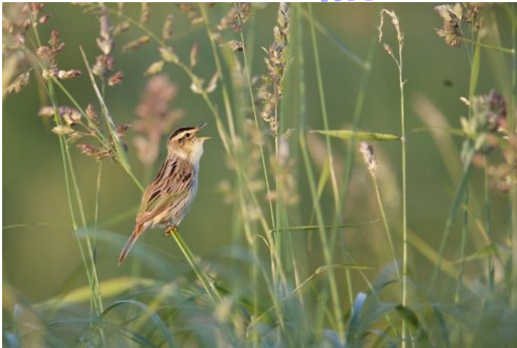
Meldinė nendrinukė .

Meldinė nendrinukė yra vienas rečiausių šlapių pievų paukščių Europoje. Jie peri tik keturiose šalyse: Baltarusijoje , Lenkijoje , Ukrainoje ir Lietuvoje .