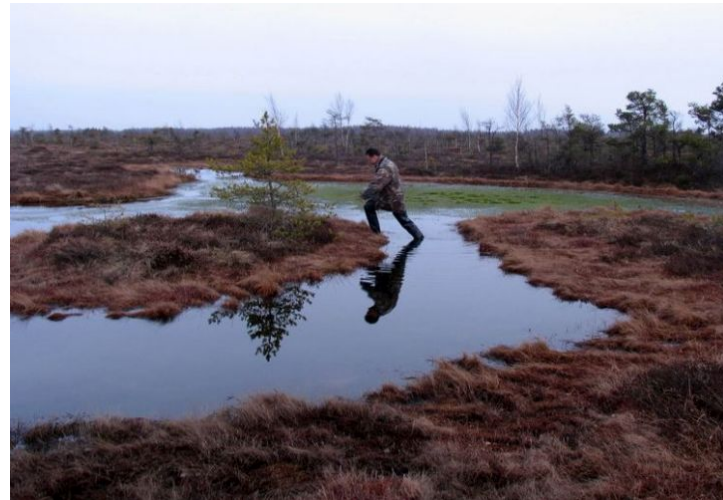
Nemuno deltos pelkės , kurias mėgsta meldinė nendrinukė . (alkas.lt)