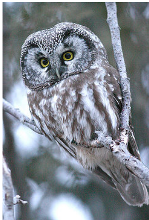
Lėlys kiaušinius deda tiesiai ant žemės.

Vieni paukšteliai turi labai mažus snapelius. Jie nepajėgia nešioti lizdai medžiagų. Todėl jie nestato lizdo. Jie kiaušinius deda tiesiai ant žemės, duobutėje, arba medžių uoksuose .