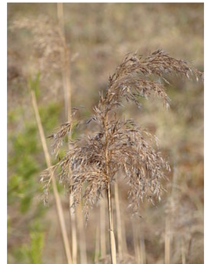
Nendrė (wikipedia nuotr.):