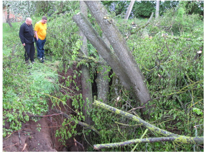
Smegduobė.

Vienas berniukas iš mokyklos grįžęs skubėjo pas draugus. Išbėgdamas iš namų jis smarkiai trinktelėjo verandos duris. Truputį pabėgęs staiga išgirdo dundesį. Žiūri – verandą prarijo žemė. Duobė buvo tokia gili, kad tesimatė verandos stogas.