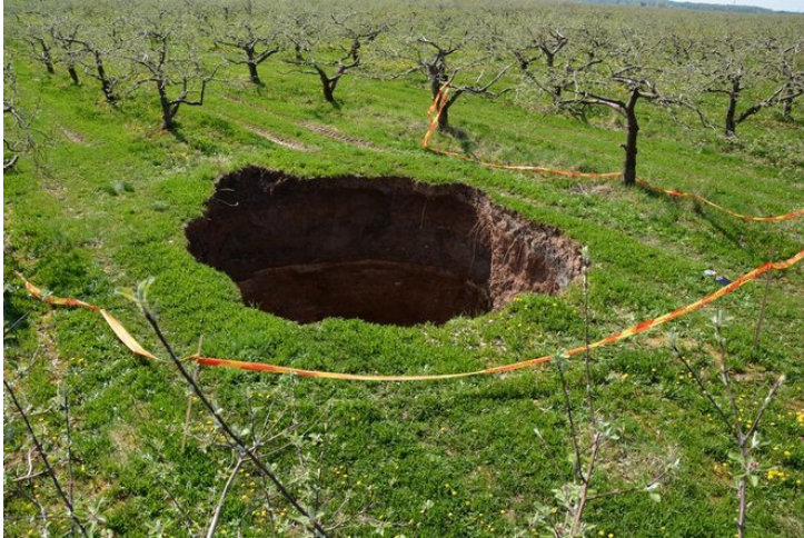
Smegduobė obelų sode šiaurės Lietuvoje.

Praeitą pavasarį viename obelų sode šiaurės Lietuvoje vieną dieną atsirado duobutė. Niekas į ją nekreipė dėmesio. Duobė ėmė vertis . Pradžioje su žemėmis įgriuvo viena obelis, po to antra.